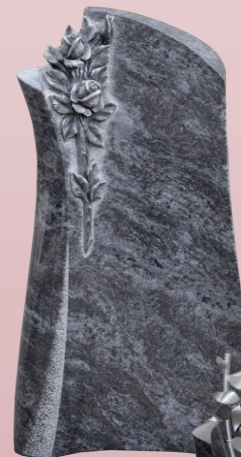
▲ Gestaltungsvariante 2 Modell Nr. 081204* Material Orion Verzierung Rosen