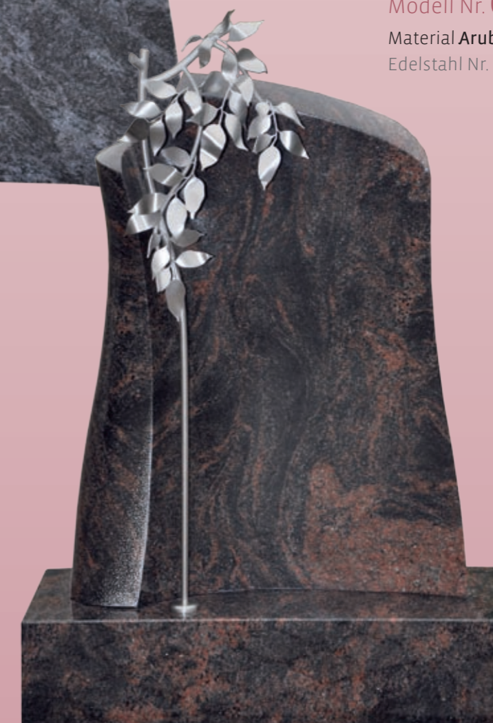
▶ Gestaltungsvariante 3 Modell Nr. 081107* Material Aruba Edelstahl Nr. ED 8543*