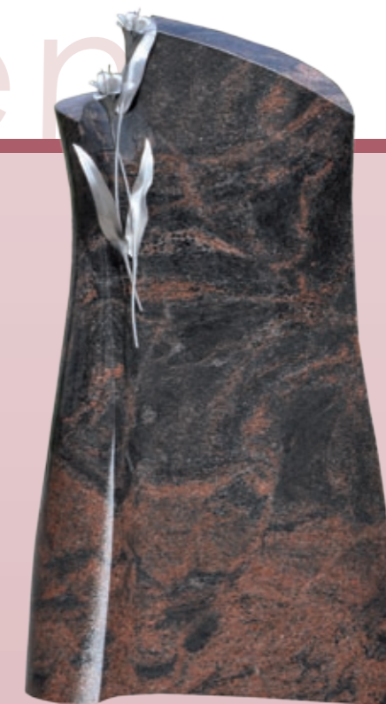
▲ Gestaltungsvariante 1 Modell Nr. 081107* Material Aruba Edelstahl Nr. ED 8617*