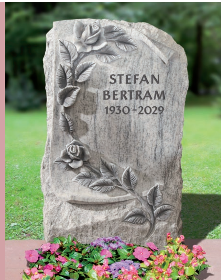
Modell Nr. 091532* Material Viskont White Schrift MG-254 Verzierung Schriftrolle mit Rosenranke