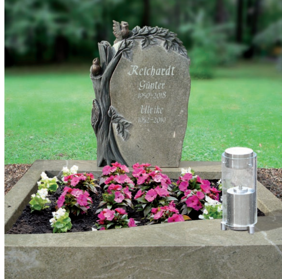
Modell Nr. 061253* Material Spring Green Schrift Schwung 2 Verzierung Baum mit Vögel Laterne Nr. ED 9111*