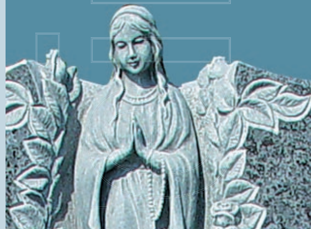
Modell Nr. GR 012413* Material Orion SG