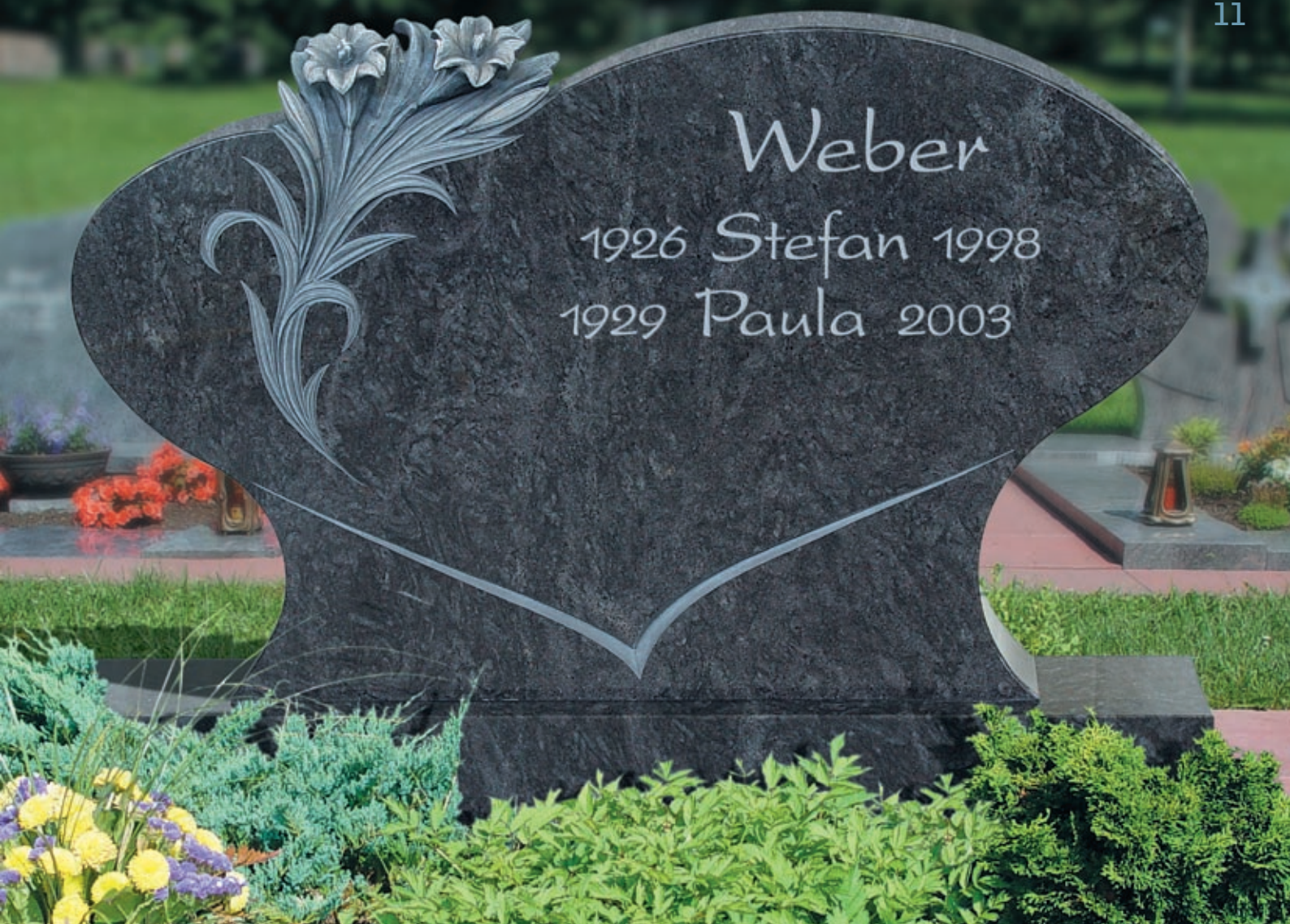
Modell Nr. GR 032405* Material Orion SDG

*Geschmacksmusterschutz Nr. DE 403 063 49.3